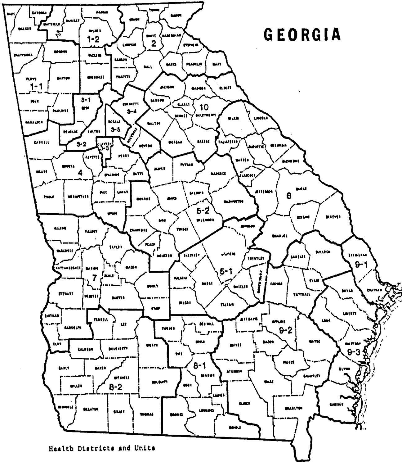
Health Districts and Units